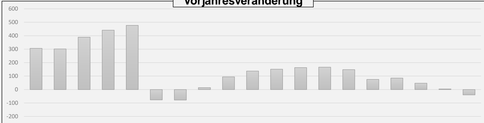
Arbeitslosigkeit in den Rechtskreisen SGB III und SGB II Cottbus, Stadt Oktober 2024