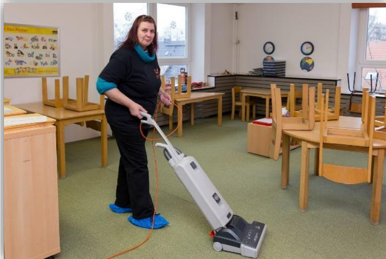
Kitas Hopfengarten & Greifenhainer Str.