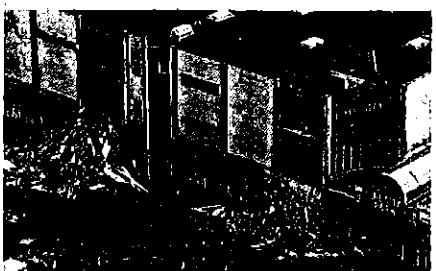
Der Abriss läuft: Sichtbar ist das an der Seite, an dem Hoffmann-Möbel früher war. Der gesamte Komplex in Groß Gaglow kommt nach der Entkernung weg.