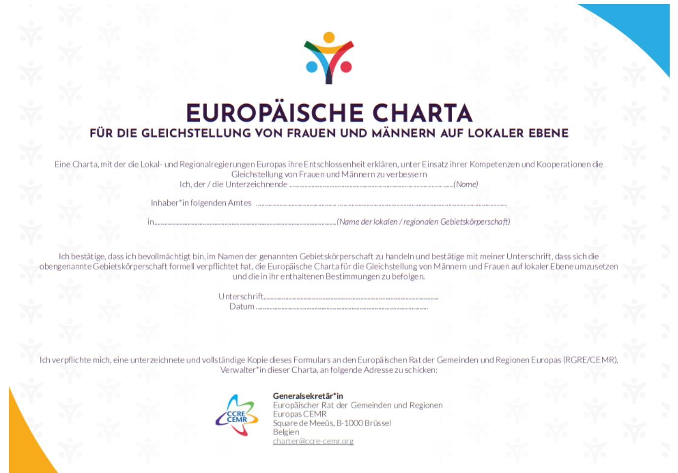
Bild: Foto von RGRE/CEMR-Broschüre „Europäische Charta für die Gleichstellung von Frauen und Männern auf lokaler Ebene“