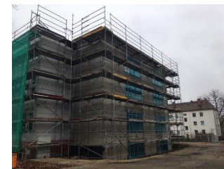
2. BA Anbau Schule