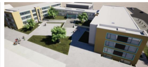
2. + 3. BA Visualisierung Schule TFS mit Anbauten