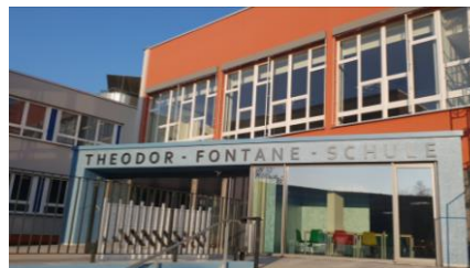
1. BA Aula