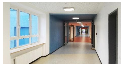
1. BA Flur