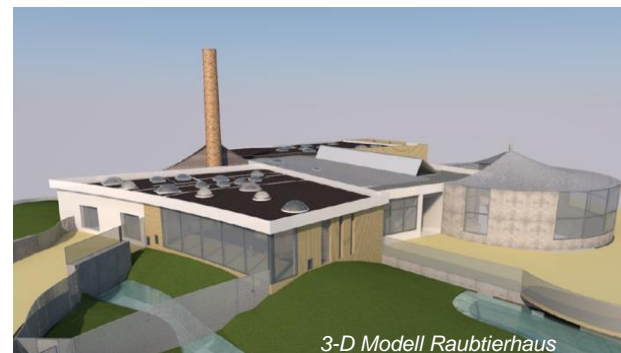
3-D Modell Raubtierhaus

Realisierung: nationale, kleinteilige, gewerkweise Vergabe der Bauleistungen (VOB) in ca. 25 Baulosen