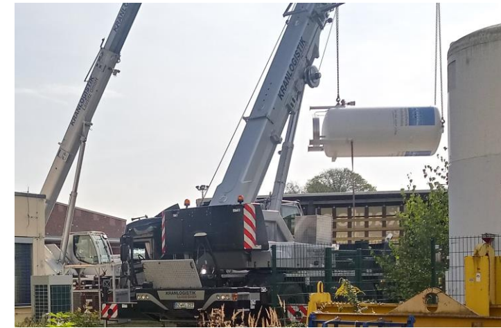
Umverlegung von Leitungen