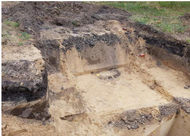
Prospektion von Bodendenkmälern