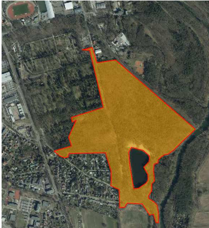
Abb.: Skizze unmaßstäblich /A. Wach