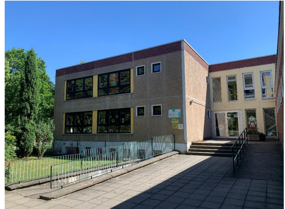
B.3 Kita „Pfiffikus“