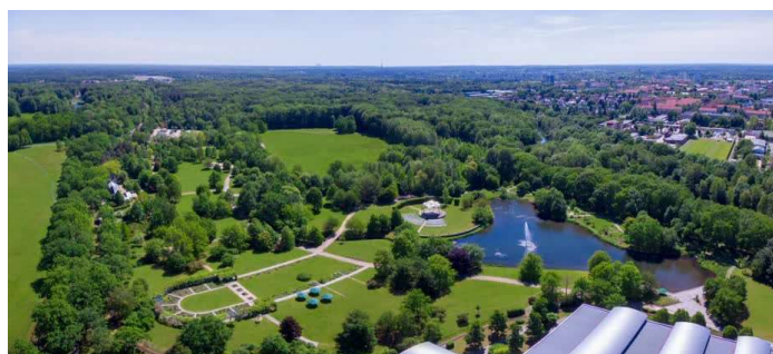
Spreeauenpark mit Caravanstellplatz & Parkcafé