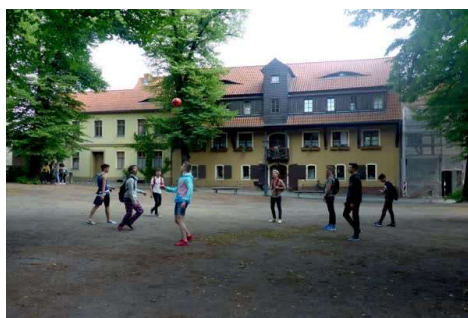
Jugendherberge & Gästehaus