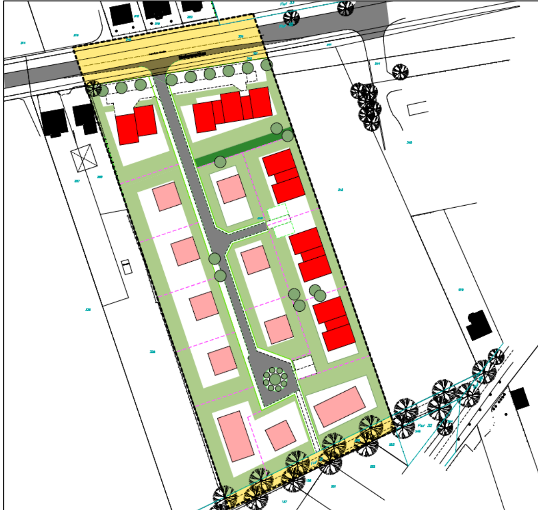
Städtebauliches Strukturkonzept