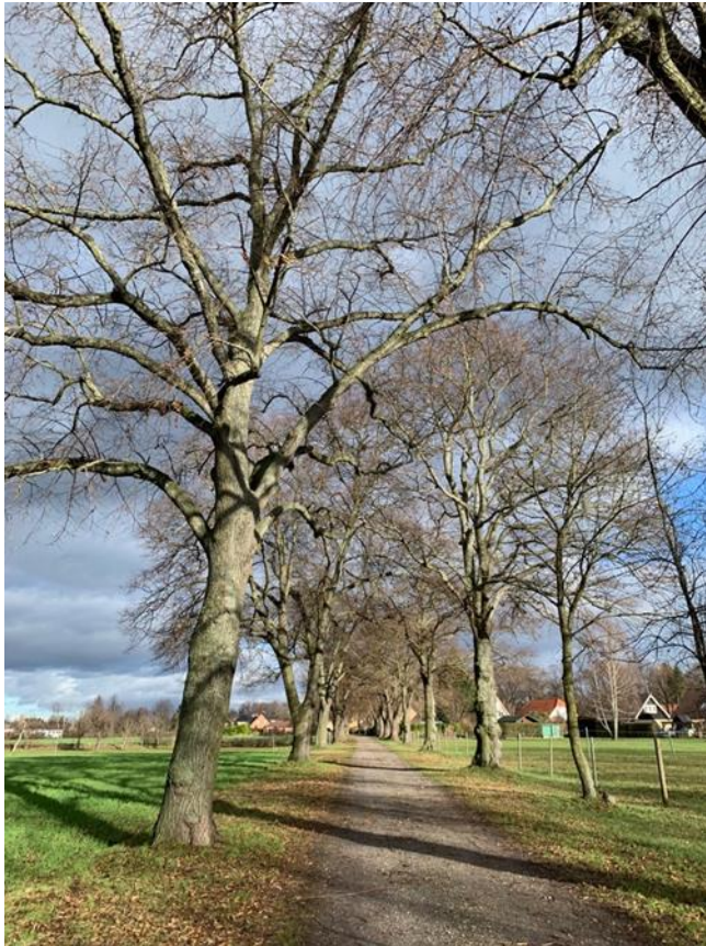
Abb. 3: Lindenallee im Verlauf der Klein Ströbitzer Straße in Richtung Osten, die in diesem Bereich unbefestigt ist.

Weiterhin verfügt die Stadt Cottbus über eine Baumschutzsatzung (Satzung zum Schutz von Bäumen der Stadt Cottbus - Cottbuser Baumschutzsatzung (CBSchS) -) von 2013. Der Geltungsbereich der Satzung umfasst die im Zusammenhang bebauten Ortsteile (§ 34 BauGB) und alle Geltungsbereiche der Bebauungspläne gemäß § 30 BauGB. Abschließende Aussagen zum Schutzstatus der „Friedhofsallee“ erfolgen im weiteren Verfahren.