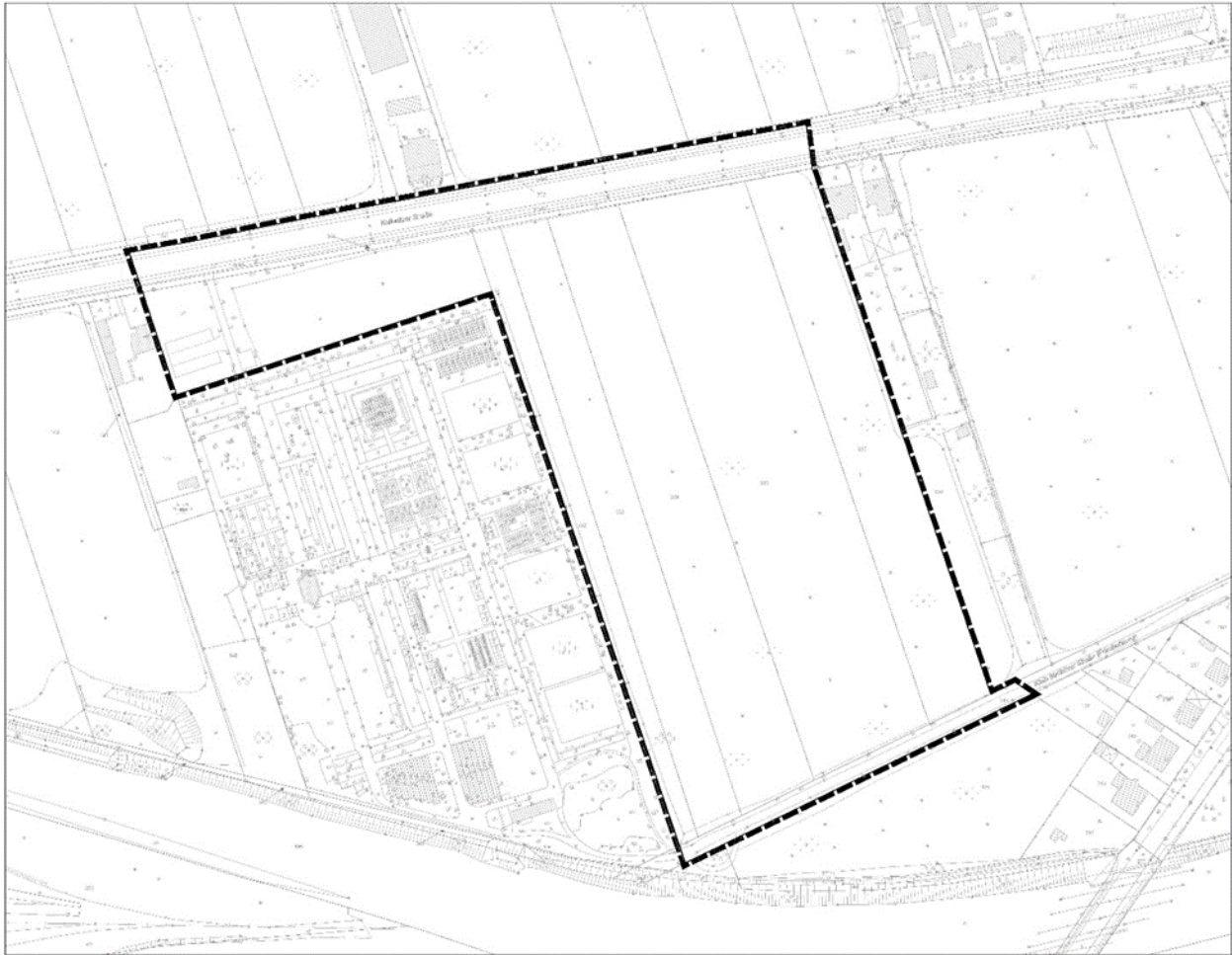
Abb. 1: Abgrenzung Geltungsbereich

Der räumliche Geltungsbereich des Bebauungsplanes betrifft