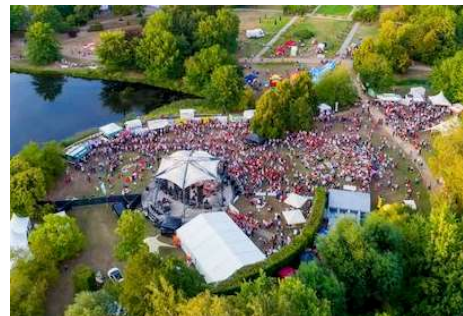
Spreeauenpark mit Caravanstellplatz & Parkcafé